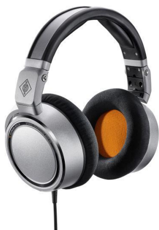
Le casque de studio Neumann NDH 20

Les casques Neumann NDH 20 sont des solutions d'une précision exceptionnelle pour le monitoring de studio. A ceux-ci s'ajoutent les casques et micro-casques HD 25 et HD/HMD 300 de Sennheiser pour studio de production et tournage vidéo.