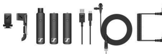
Le XS Wireless Digital fonctionne partout dans le monde dans la bande sans licence 2,4 GHz ; modèle illustré XSW-D ENG Set